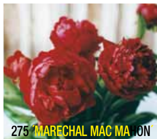
275 'MARECHAL MAC MAHON'