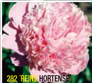
282 'REINE HORTENSE'