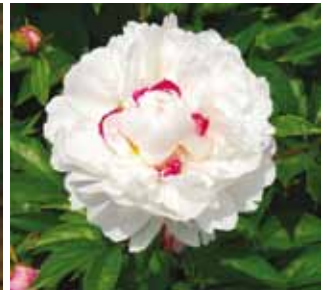
331 'ZHU SHA DIAN YU' "Tulenpunaisia täpliä jadessa"