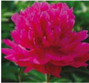
324 'HONG XIU QIU' "Punainen silkkipallo"