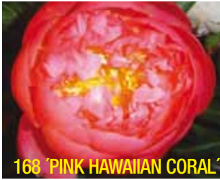
168 'PINK HAWAIIAN CORAL'