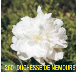
260 'DUCHESS DE NEMOURS'