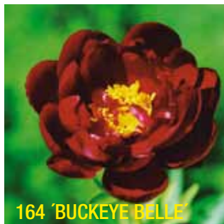
164 'BUCKEYE BELLE'