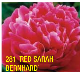
281 'RED SARAH BERNHARD'