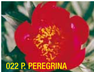
022 P. PEREGRINA