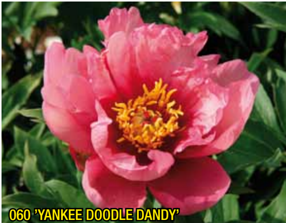
060 'YANKEE DOODLE DANDY'