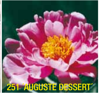
251 'AUGUSTE DESSERT'