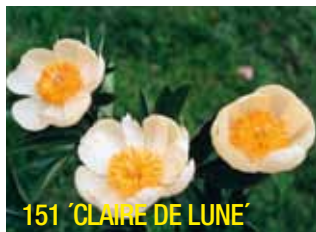
151 'CLAIRE DE LUNE'