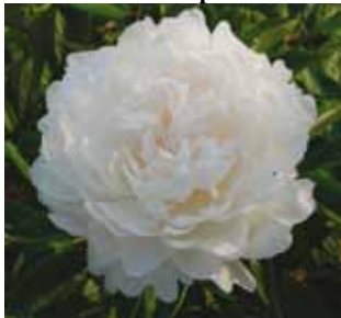
329 'YANG FEI CHU YU' "Jalkavaimo nousee kylvystä"