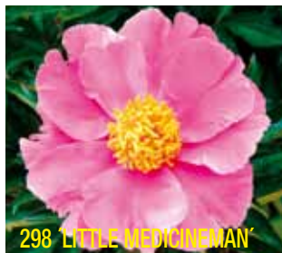
298 'LITTLE MEDICINEMAN'