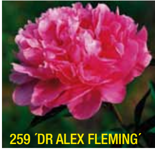
259 'DR ALEX FLEMING'