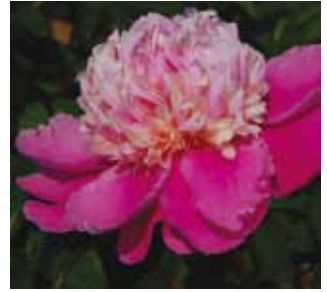
320 'CHUN XIAO' "Kevätaamu"

Tässä ovat viime vuonna markkinoille tuomamme Kiinassa jalostetut kiinanpionit. Pari lajiketta on pudonnut pois, mutta suuri osa oheisista kymmenestä lajikkeesta tulee jäämään valikoimaamme. Onhan siellä joukossa aivan herkullisia lajikkeita. Niiden lajikenimet ovat käsittelemättömiä joskin kuvaavia. Siksi ne ovat myös käännöksinä suomeksi. Kaikki uudet kiinanpionit ovat kahden litran ruukuissa. Löydät nämä pionit kiinanpionien hintalistan alaosasta sivulta 13.