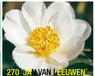
270 'JAN VAN LEEUWEN'