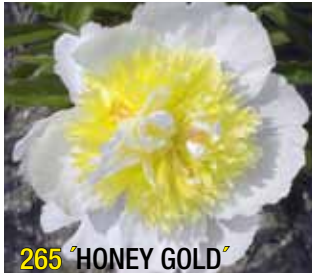
265 'HONEY GOLD'