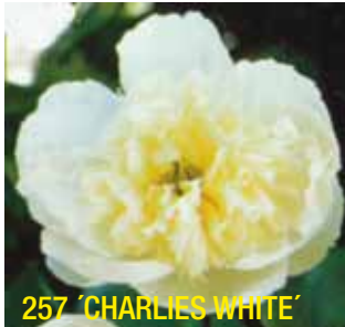
257 'CHARLIES WHITE'