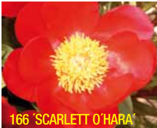
166 'SCARLETT O'HARA'