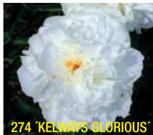
274 'KELWAYS GLORIOUS'