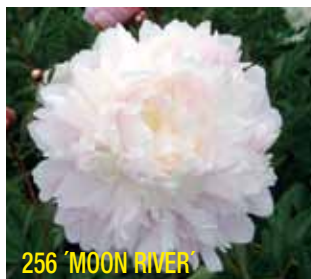
256 'MOON RIVER'