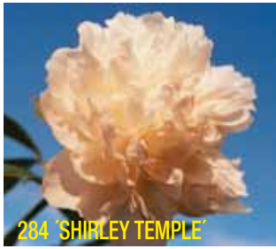
284 'SHIRLEY TEMPLE'