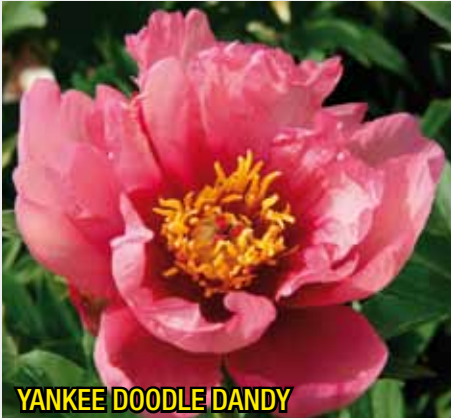
YANKEE DOODLE DANDY