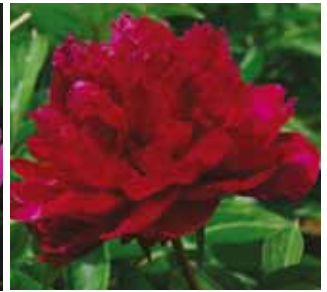
323 'HEI ZHEN ZU' "Musta helmi"