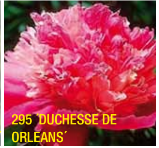
295 'DUCHESS DE ORLEANS'