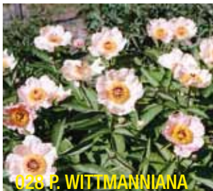
028 P. WITTMANNIANA