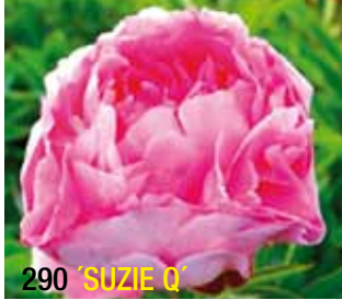
290 'SUZIE Q'