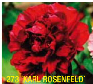
273 'KARL ROSENFELD'