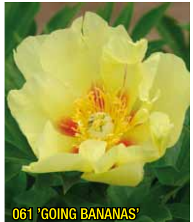
061 'GOING BANANAS'