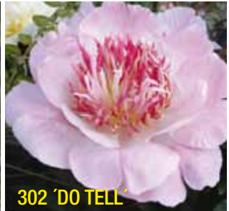
302 'DO TELL'