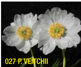
027 P. VEITCHII