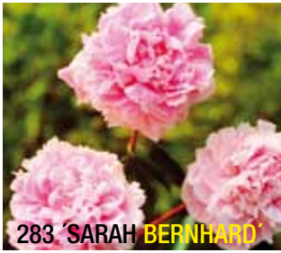
283 'SARAH BERNHARD'