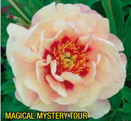
MAGICAL MYSTERY TOUR