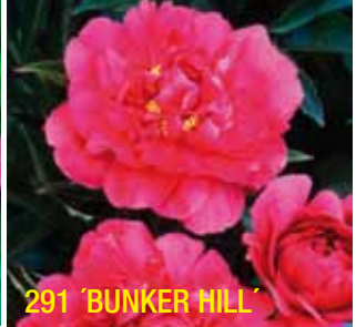
291 'BUNKER HILL'