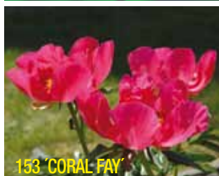
153 'CORAL FAY'