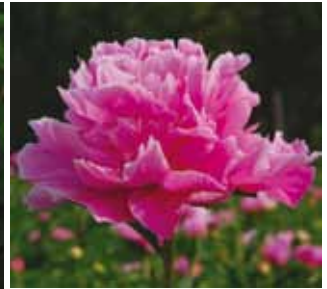
328 'TAO HUA FEI XUE' "Sininen helmi"