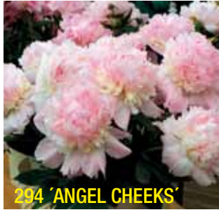
294 'ANGEL CHEEKS'