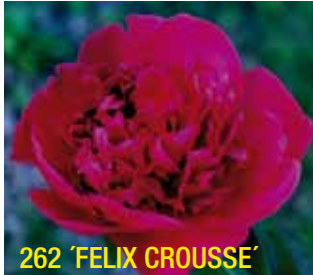
262 'FELIX CROUSSE'