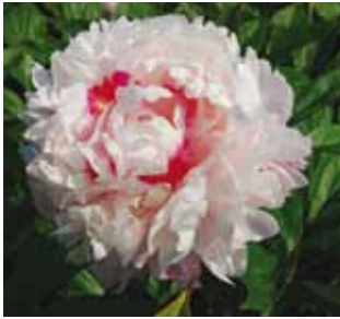
321 'FEN CHI JIN YU' "Punaisen lammen kultakala"