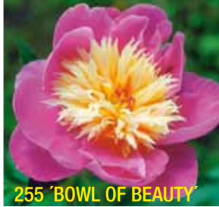
255 'BOWL OF BEAUTY'