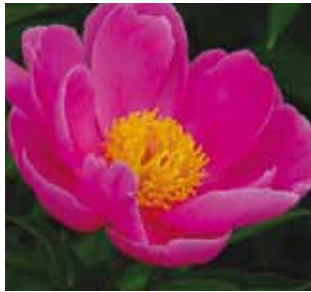
322 'FEN YU NU' "Vaaleanpunainen jadeneito"