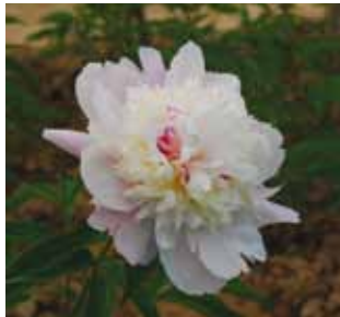
330 'YAN ZHI DIAN YU' "Juhlapukuinen rakastaja"