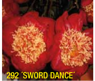
292 'SWORD DANCE'