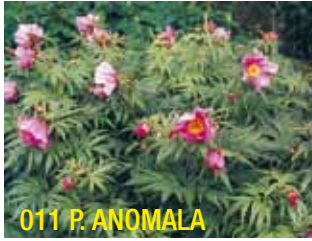
011 P. ANOMALA