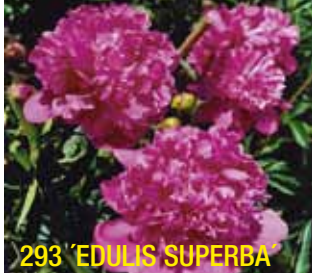
293 'EDULIS SUPERBA'