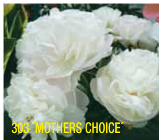
303 'MOTHERS CHOICE'