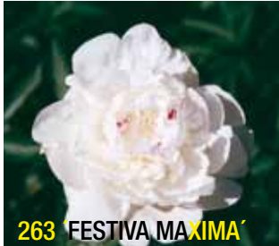
263 'FESTIVA MAXIMA'