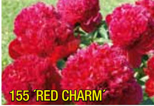
155 'RED CHARM'