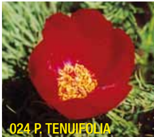
024 P. TENUIFOLIA