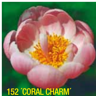
152 'CORAL CHARM'