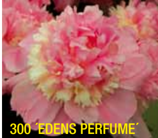
300 'EDENS PERFUME'