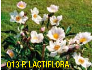
013 P. LACTIFLORA