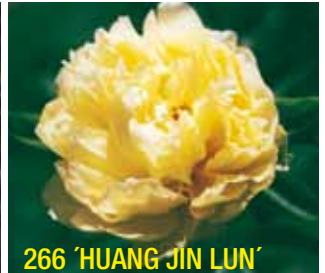
266 'HUANG JIN LUN'