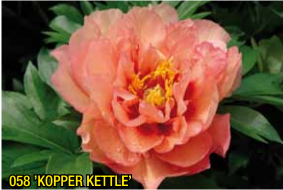
058 'KOPPER KETTLE'