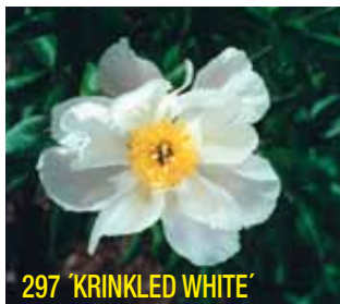
297 'KRINKLED WHITE'