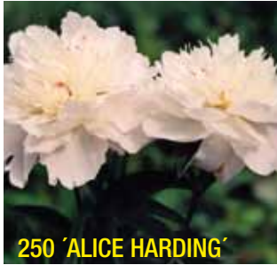
250 'ALICE HARDING'

Viime vuosina on kiinanpionien kasvatusta edennyt pohjoiseen päin. Niitä on menestyksellä kokeiltu yhä ylempänä Tornion- ja Kemijokien varsilla. Kiinanpioni kasvaa suotuisilla kasvupaikoilla Etelä-Lapissa, vyöhykkeillä VI-VII.