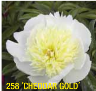
258 'CHEDDAR GOLD'