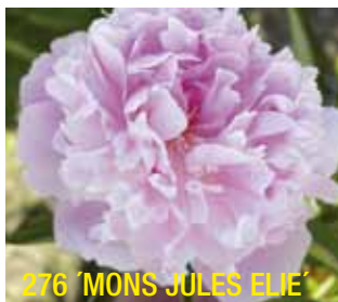
276 'MONS JULES ELIE'