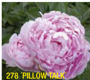
278 'PILLOW TALK'