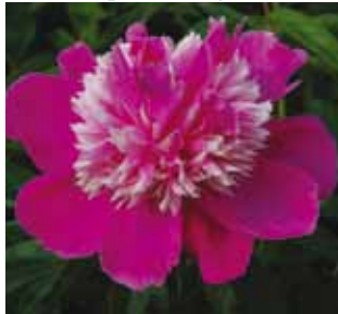
327 'QI HUA LU SHUANG' "Huurretta suuteleva kukka"