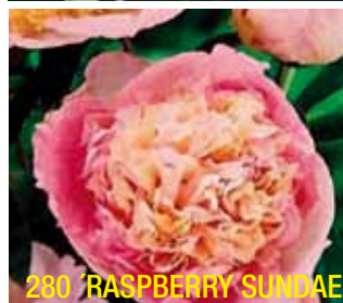
280 'RASPBERRY SUNDAE'