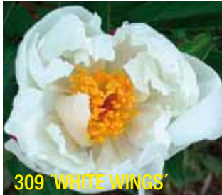
309 'WHITE WINGS'