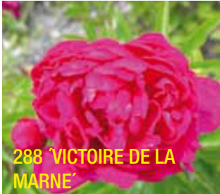
288 'VICTOIRE DE LA MARNE'