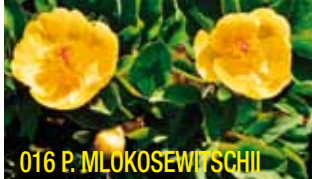
016 P. MLOKOSEWITSCHII