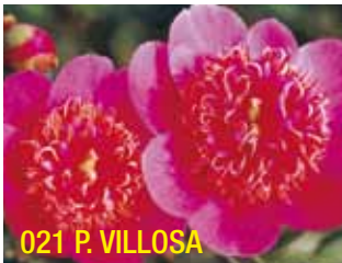
021 P. VILLOSA