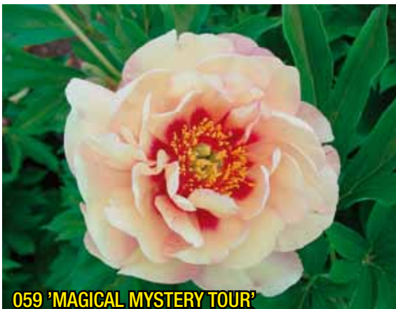
059 'MAGICAL MYSTERY TOUR'

'BARTZELLA' isoja heti kukkivia jakotaimia